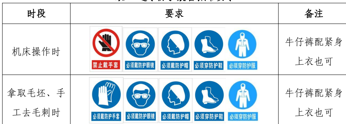
表 6 选手防护装备佩带要求

大赛时，裁判员对违反安全与健康条例、违反操作规程的选手和现象将提出警告并进行纠正。不听警告，不进行纠正的参赛选手会受到不允许进入竞赛现场、罚去安全分、停止加工、取消竞赛资格等不同程度的惩罚。选手防护装备佩带要求见表 6。