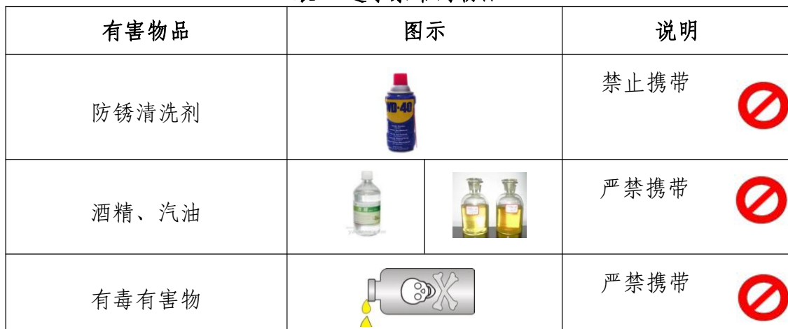
表 7 选手禁带的物品