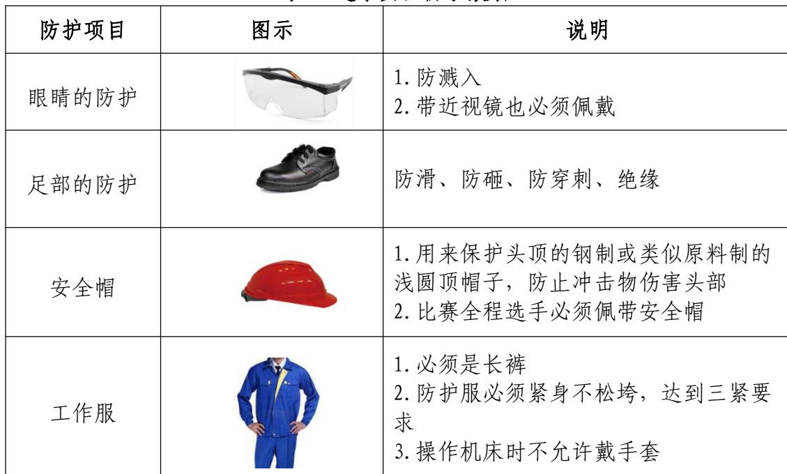
表 5 选手安全防护装备

大赛时，裁判员对违反安全与健康条例、违反操作规程的选手和现象将提出警告并进行纠正。不听警告，不进行纠正的参赛选手会受到不允许进入竞赛现场、罚去安全分、停止加工、取消竞赛资格等不同程度的惩罚。选手防护装备佩带要求见表 6。