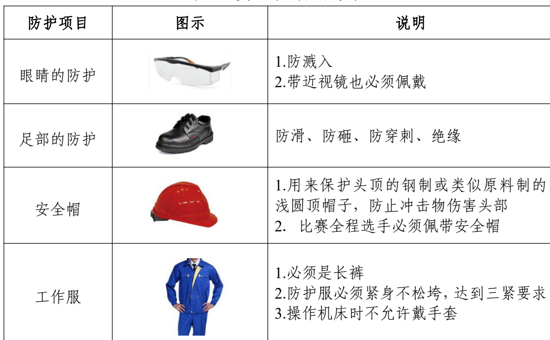
表 5 选手必备的防护装备