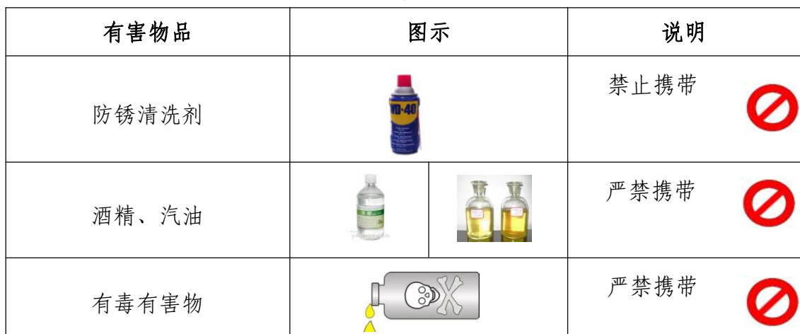
表 7 选手禁带的物品