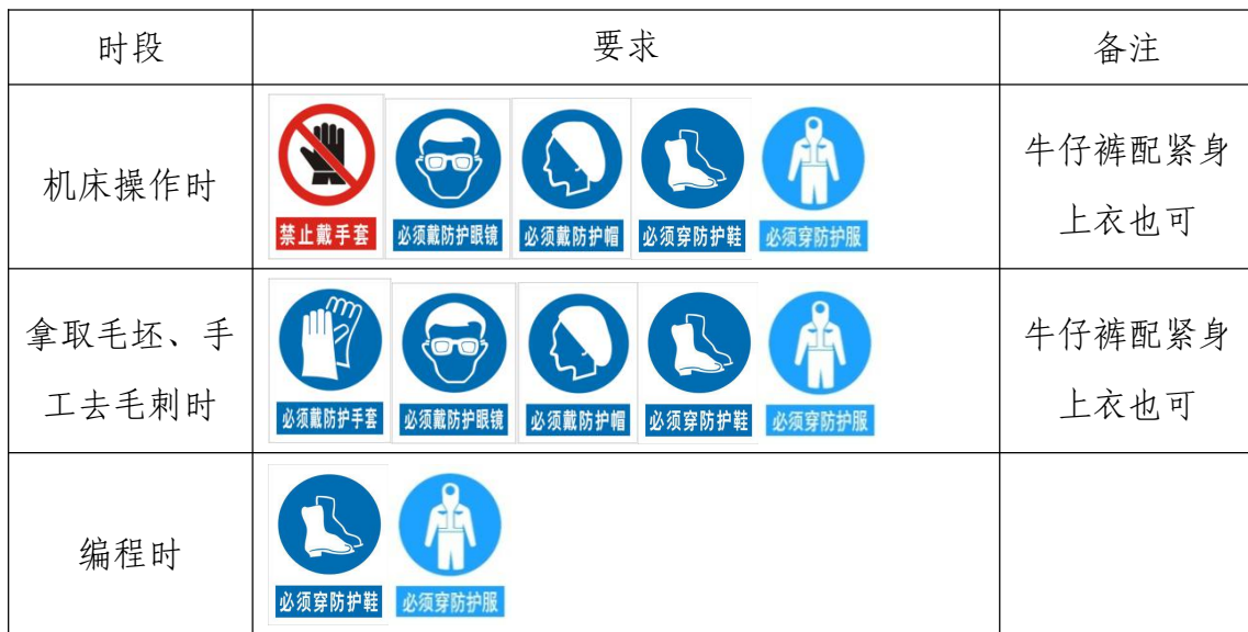
表 6 选手防护装备佩带要求

大赛时，裁判员对违反安全与健康条例、违反操作规程的选手和现象将提出警告并进行纠正。不听警告，不进行纠正的参赛选手会受到不允许进入竞赛现场、罚去安全分、停止加工、取消竞赛资格等不同程度的惩罚。选手防护装备佩带要求见表 6。